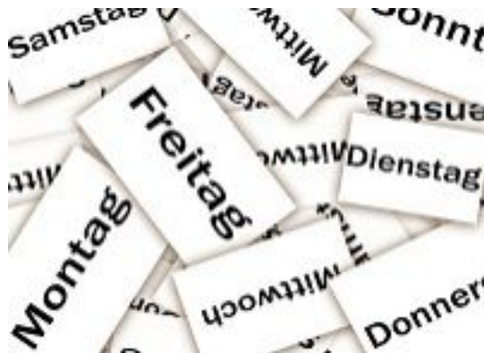
Wochenrückblick (200x146 Pixel, 18 kB)